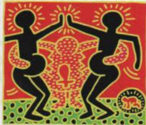
MODRICO e ROBERTA, YAM HONG

Il tema scelto per il XXIII° Congresso Nazionale "Madri al limite: Disuguaglianze e salute riproduttiva" è estremamente attuale e complesso.